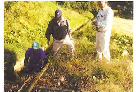
施設の点検及び現状確認