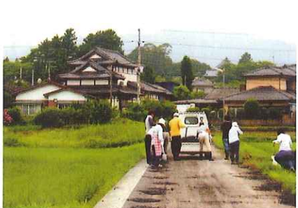
農道の補修作業（敷き砂利）