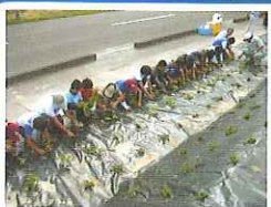
グラウンドカバー