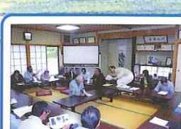
活動計画の話し合い