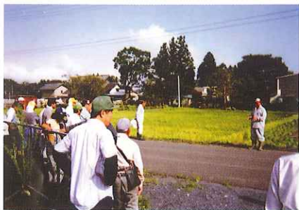
作業前の安全管理