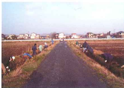
水路の江払い作業