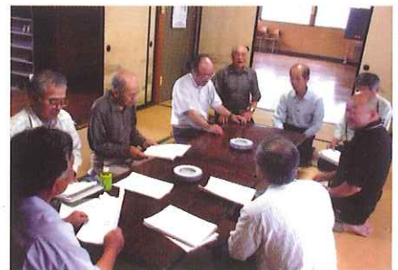
住民による話し合い(活動計画の策定)

環境保全のため、地域でどのような 活動を行えば良いかを話し合い、全 ての住民へ啓発普及を図る